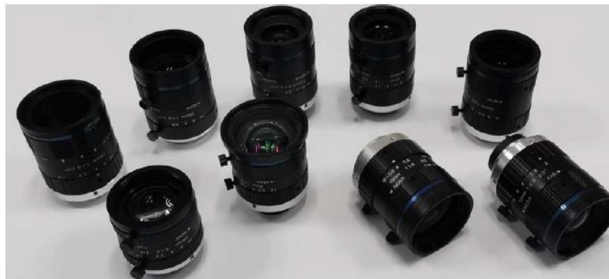
◆標準仕様 (次のページご参考)