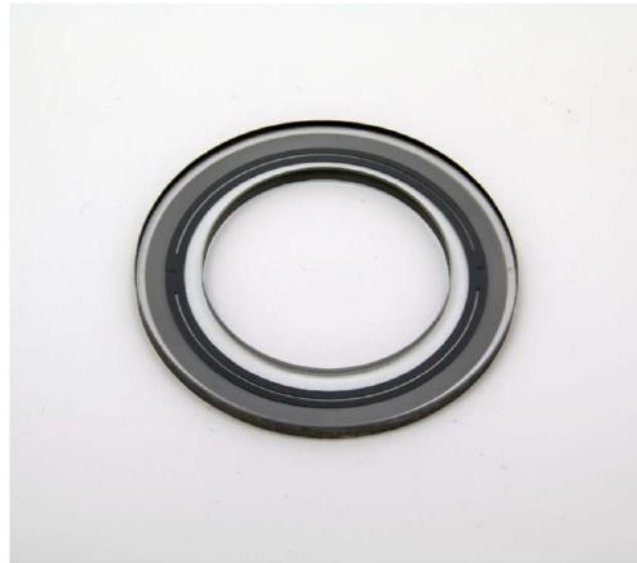
精密平面光学ガラスのサンプル