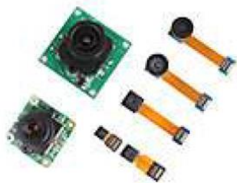
◆IR CUT FILTER