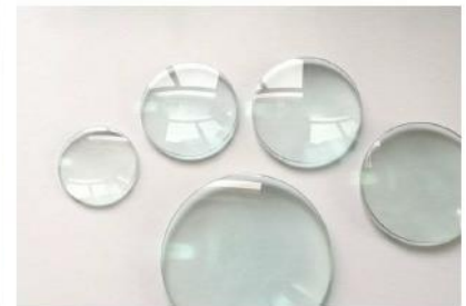
精密平面光学ガラスのサンプルと応用例